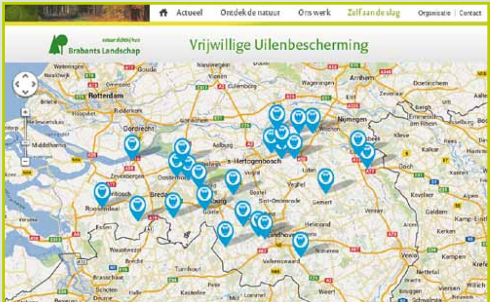
Dit kaartbeeld is in ontwikkeling en is daardoor nog niet volledig.

Op www.brabantslandschap.nl/zelf-aan-de-slag/vrijwilligerswerk is meer informatie te vinden. Bovendien kunnen geïnteresseerden via een interactieve kaart op zoek naar een uilenwerkgroep dicht bij huis.