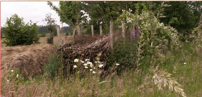
Houtmijt of mutserd

Een houtmijt is een grote berg op elkaar gestapelde takken. Voor u een handige plaats om snoeihout op te bergen. Voor kleine zoogdieren van levensbelang.