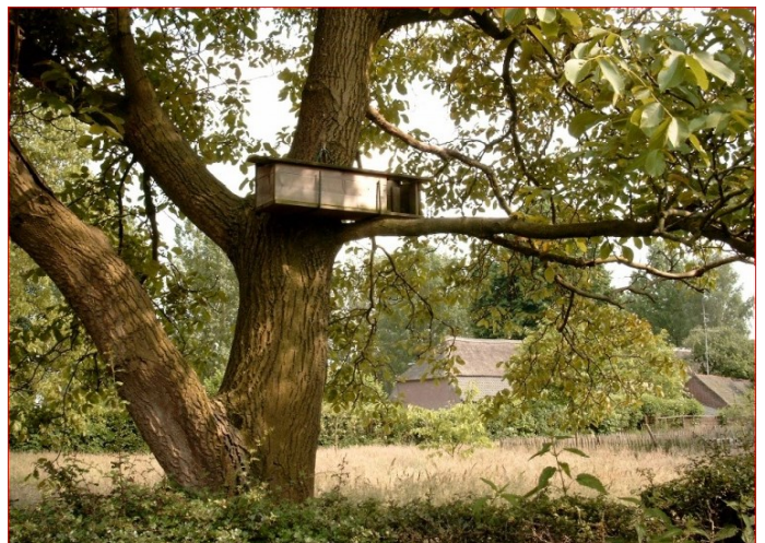
Steenuilenkast op een voor uilen geschikt erf

Whuuuhup, whuuuhup, wiehw, wiehw. Door dat mysterieuze geluid werd de steenuil vroeger doodsroeper genoemd. Zodra je weet wie er achter het geluid zit, is het prachtig om te horen. Helaas roepen ze maar af en toe.