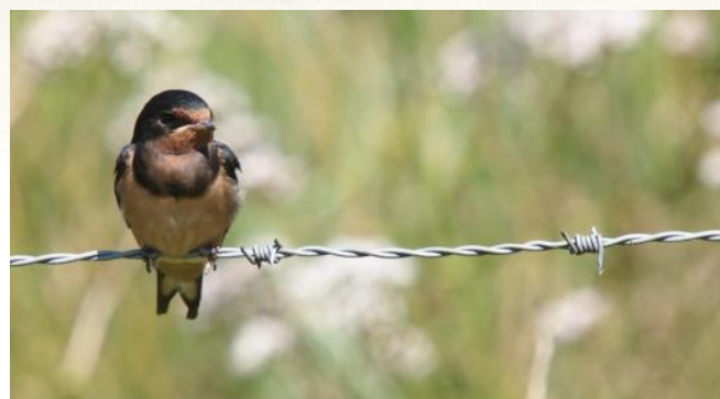
Boerenzwaluw op prikkeldraad

Boerenzwaluwen die de barre tocht van 9000 kilometer heen en weer terug hebben overleefd, keren jaar na jaar op dezelfde broedplaats terug. Meestal wordt het oude nest hersteld en opnieuw door het zwaluwpaar in gebruik genomen; dat spaart tijd en energie! Volgens een ruwe schatting broeden er in Nederland zo'n 100.000 tot 200.000 paren. Jaarlijks maken ze 2-3 legfels, ieder legfel met 4-5 eieren. Het nest is een schotelvorming open kommetje van aarde, vermengd met speeksel en strotjes.