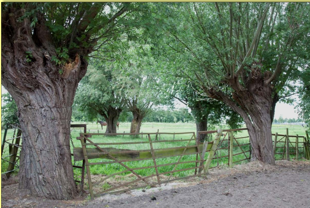
De voedselsituatie wordt verbeterd door onder ander knobomen, een grazige weide, kruidenrijke randen.