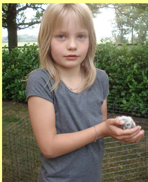
Een toekomstige uilenbeschermster?

Het Brabantse beschermingsnetwerk steenuil en kerkuil mag gerust een succesverhaal genoemd worden. De essentie van dit succes zit 'm in de betrokkenheid van mensen bij deze vogels. Het is ongelofelijk hoe toegewijd en soms fanatiek mensen (beschermers én gastgevers) bezig zijn met 'hun' uilen. Wij verbazen ons daar nog dagelijks over maar we begrijpen het natuurlijk wel. Ook wij proberen via lezingen, cursussen, persberichten, nieuwsbrieven en jaarverslagen mensen warm te krijgen voor uilenbescherming. Maar wat het beste werkt is nog altijd het laten zien en beleven van de uilen zelf. In de jongenfase is het geruststellend om te weten dat de uilen zich niet of nauwelijks laten verstoren (in de eifase is dat wel degelijk het geval!). Onze uilenbeschermers – de kastcontroleurs – grijpen daarom de gelegenheid aan om bij het aantreffen van jongen in de kast, deze te laten zien aan de gastgevers. Ze mogen