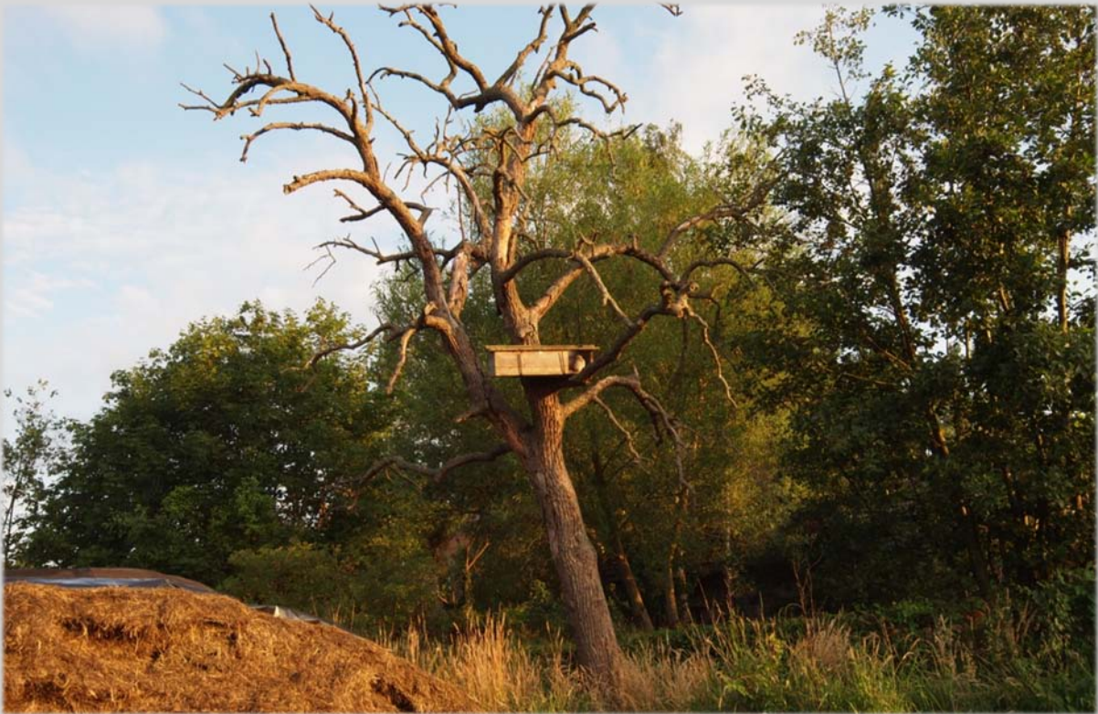
Deze steenuil heeft zijn nieuwe stekkie snel gevonden.

We hopen dat deze jonge steenuil zijn vaste intrek heeft genomen en ooit zelf jonge uiltje groot brengt. De veldmedewerkers van het Coördinatiepunt leveren op verzoek nestkasten uit aan Brabantse uilenwerkgroepen. Soms wordt, in overleg met de lokale werkgroep, de nestkast direct afgeleverd bij de gastgevers. Vanaf dat moment nemen de vrijwillige uilenbeschermers het beheer van de kast over.