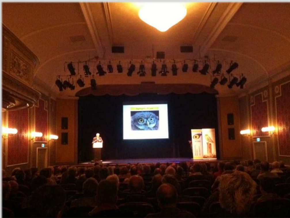
De landelijke uilendag in Schouwburg Ogterop.

bescherming van de Laplanduil in Wit-Rusland. Van de dag is door ons een verslag gemaakt dat verspreid is onder de uilenwerkgroepen. Mensen die interesse hebben om het verslag te lezen kunnen een email sturen naar uilenbeschermingbrabant@gmail.com .