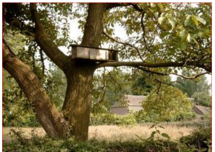
Steenuilenkast op een voor uilen geschikt erf

Whuuuhup, whuuuhup, wiehw, wiehw. Door dat mysterieuze geluid werd de steenuil vroeger doodsroeper genoemd. Zodra je weet wie er achter het geluid zit, is het prachtig om te horen. Helaas roepen ze maar af en toe.