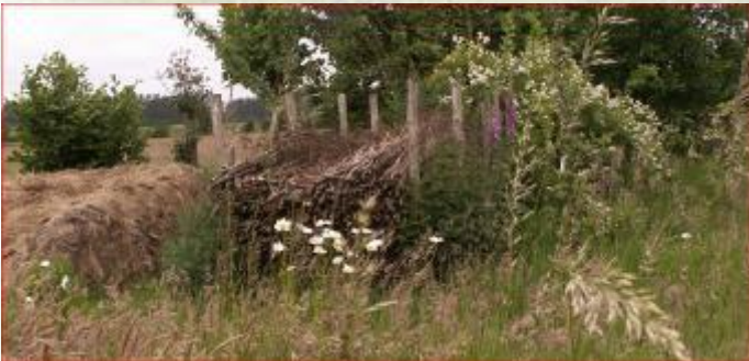
Houtmijt of mutserd

Een houtmijt is een grote berg op elkaar gestapelde takken. Voor u een handige plaats om snoeihout op te bergen. Voor kleine zoogdieren van levensbelang.