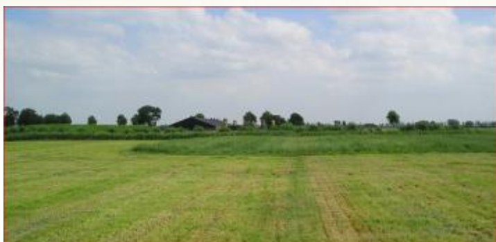
Rustzone wordt later gemaaid

Waar mogelijk: Op kansrijke graslanden in gebieden waar weidevogels voorkomen. Weidevogelvrijwilligers bekijken welke plaatsen in aanmerking komen. Een goede rustzone is minimaal 0,1 en maximaal 1 hectare groot. In de periode dat vogels actief zijn, vinden er geen werkzaamheden in de zone plaats. De rustzones zijn speciaal bedacht voor de gebieden waarvoor geen collectief beheerplan weidevogels is.