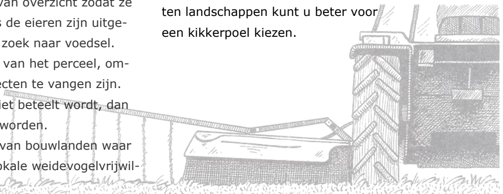
Het gebruik van een wildredder

Waar mogelijk: Lagere plaatsen in open landschappen, liefst daar waar al weidevogels aanwezig zijn. In gesloten landschappen kunt u beter voor een kikkerpoel kiezen.