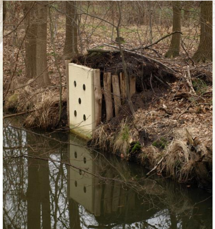
Ijsvogelwand met betonnen keerwand

Onmiskenbaar blauw-oranje gekleurd. Plomp gebouwd met korte staart en grote kop en snavel. De ijsvogel zit vaak rechtop op een laaghangende tak boven het water. Soms vliegt hij luid roepend over het water en is dan gemakkelijker te zien, maar niet voor niets is zijn bijnaam de blauwe schicht, je ziet vaak niet meer dan even een korte blauwe flits. Of je hoort hun luid fluitende roep, iets van een schril/hoog 'piep-piep'.