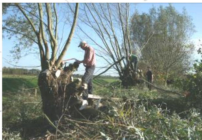
Voldoende afstand tot volgende knot bewaren

Bij het werken met zagen is het soort betanding van belang. Bij sommige zagen zoals Jirizagen en kleine snoeizagen, staan 'op trek' terwijl beugelzagen zowel op trekkend als duwend werken. Beoordeel van te voren goed of er niet de kans bestaat dat het hout gaat klemmen. Dit kan doordat de tak of boom overhangt.