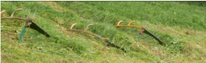
Hier rusten de zeisen op zeisstrijkers

Het werken met een zeis brengt op zich voor de persoon met de zeis nog niet zoveel gevaar met zich mee. Er moet meer rekening gehouden worden met de omstanders. Ook het wegleggen van de zeis moet met zorg gebeuren!