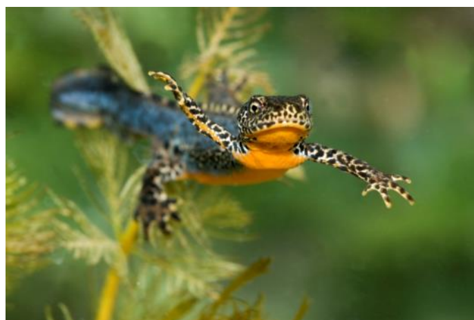
Alpenwatersalamander ( Triturus alpestris )

Om zich te kunnen voortplanten hebben amfibieën stilstaand of zwak stromend water nodig, dat in het voorjaar snel opwarmt. Ook een goede waterkwaliteit is van belang. Soorten die in Noord-Brabant voorkomen, zetten in het voorjaar hun eieren af in het water. Bij kikkers zijn dat eiklompjes, bij padden eisnoeren en bij salamanders losse eieren. Soorten als gewone pad en bruine kikker verlaten vrijwel direct daarna het water om gedurende de rest van het seizoen op het land te verblijven. Salamanders blijven langere tijd in het water, terwijl de groene kikker, de bekende kwaker, het hele seizoen in en rond het water verblijft. Larven van amfibieën kunnen niet zonder water omdat ze ademen via kieuwen.