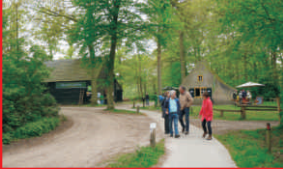
Pannenhoeft 4, Rijsbergen